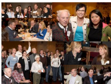
Fra FAD - Innbyggerkonferansen, 20. mars 2007