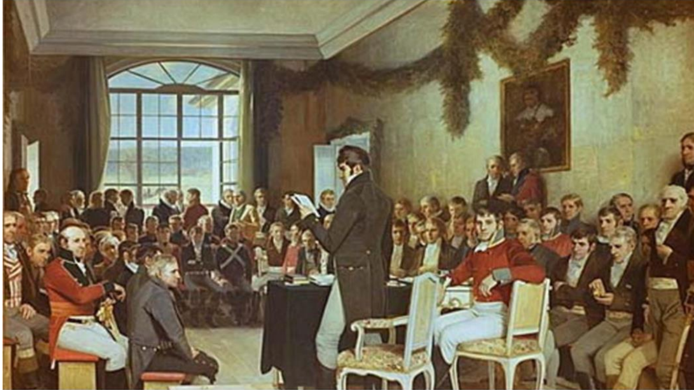
KLOKE MENN: Riksforsamlingen på Eidsvoll slik Oscar Wergeland i maleriet fra 1880-årene forestilte seg seansen.