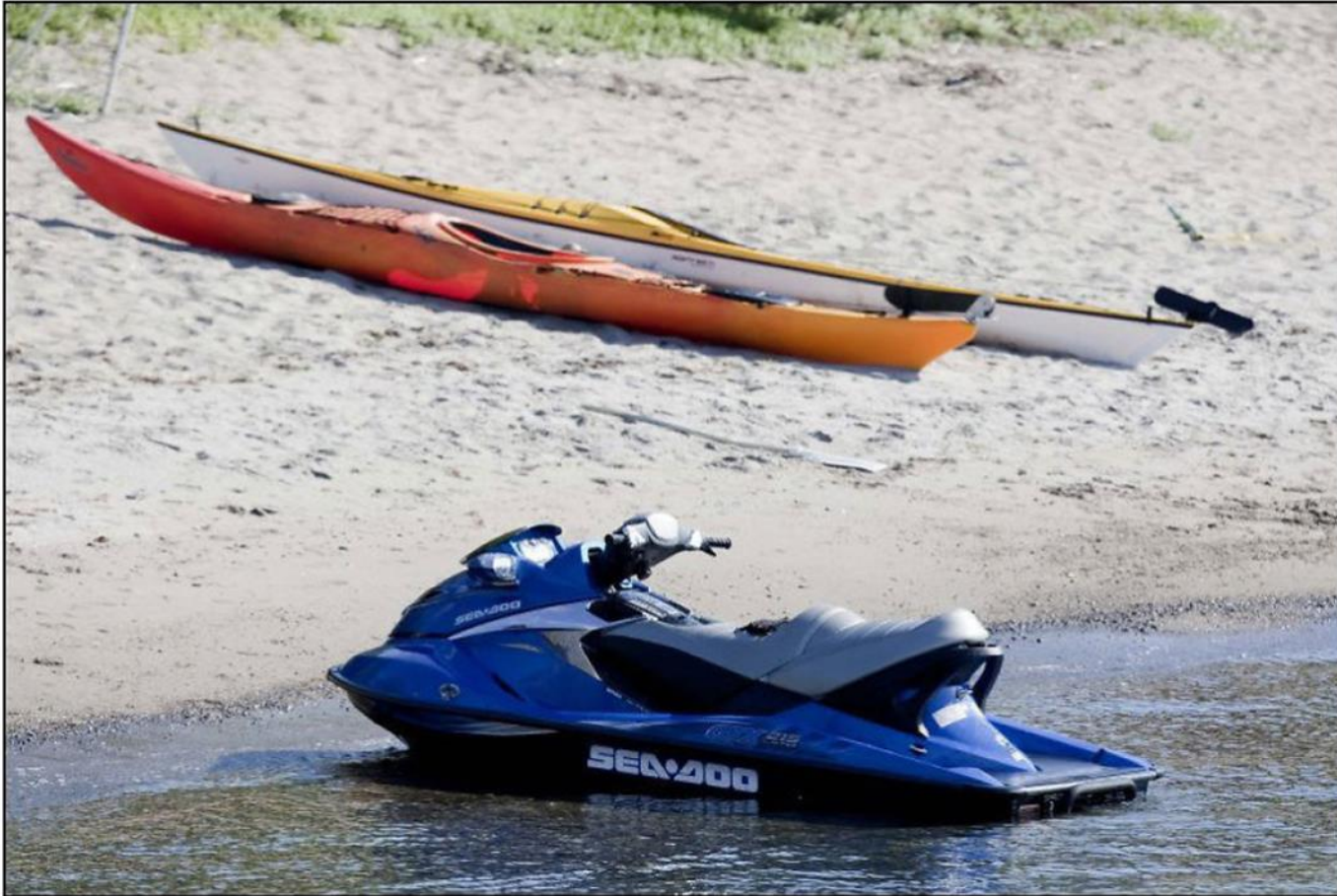
STRANDET: Vannscootere har vært ulovlig i Norge siden 6. juli i år. Nå mener ESA at forbudet bryter med EØS-reglene.