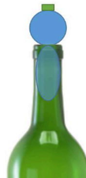
[produktet i bruk]