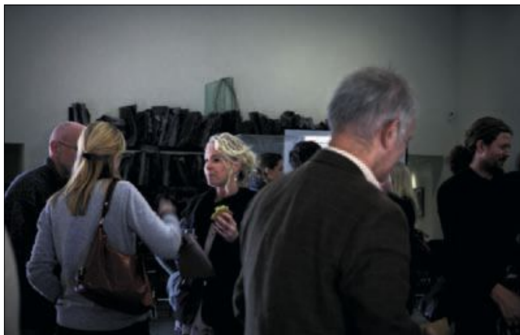
FRAMTIDA: Nasjonalmuseet og Astrup Fearnley inviterte i går til seminar om «the Future of The Museum».