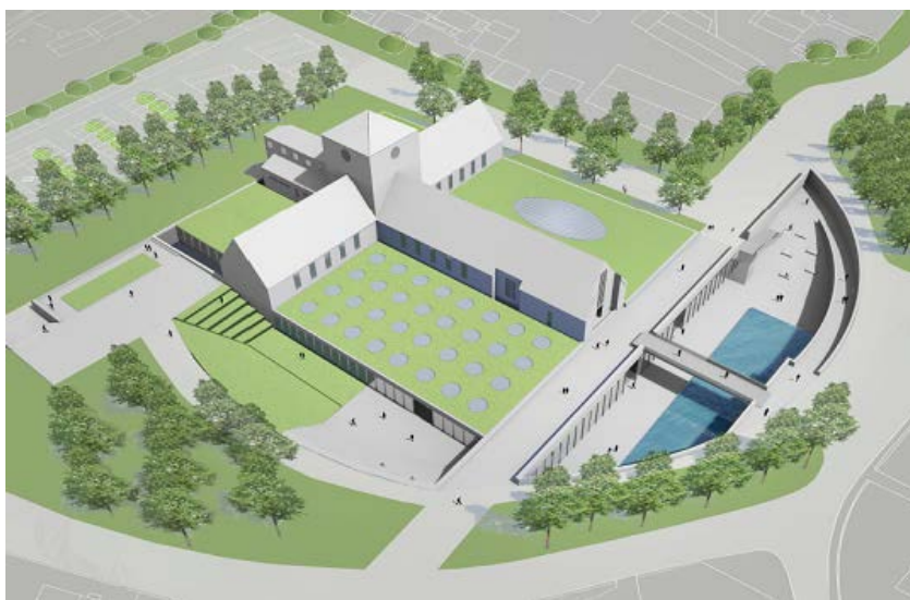
Illustrasjonen viser en mulig utvidelse på Bygdøy. Den er laget av arkitekt Kristin Jarmund i 2011.

Eiendomsavdelingen og Kulturhistorisk museum har høsten 2013 arbeidet med å slutføre programarbeidet for nytt museumsanlegg på Bygdøy. Inkludert den gamle Arnebergbygningen, er programmet på ca. 12.000 kvm brutto hvorav 9.700 kvm går med til utstillinger og annet publikumsareal. Programmet ble sluttbehandlet av styret ved KHM 6. desember 2013. Det er nå under klargjøring i Eiendomsavdelingen for oversending til KD. Det legges til grunn at KD raskt vil følge opp saken med et oppdragsbrev til Statsbygg der de bes utarbeide program for en internasjonal arkitekt- og designkonkurransen. Parallelt må Eiendomsavdelingen, i samarbeid med Statsbygg, starte forberedelsene for ny reguleringsplan for tomten på Bygdøy.