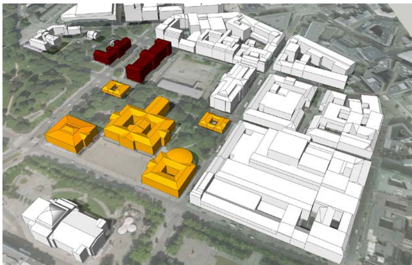
De to mørke bygningene på tegningen tilhører Kulturhistorisk museum, Historisk museum (Frederiks gt. 2) lengst til høyre. I tillegg leier museet lokaler bl.a. til administrasjonen i St. Olavsgate like ved.

Det foreslås i tillegg et nybygg på rundt 10 000 kvm brutto under Tullinløkka for museets faste og temporære utstillinger, auditorium, undervisningsrom og publikumstilbud som kafé, butikk etc. Det må også sikres finansiering av nye basisutstillinger i Historisk museum når den tid kommer.