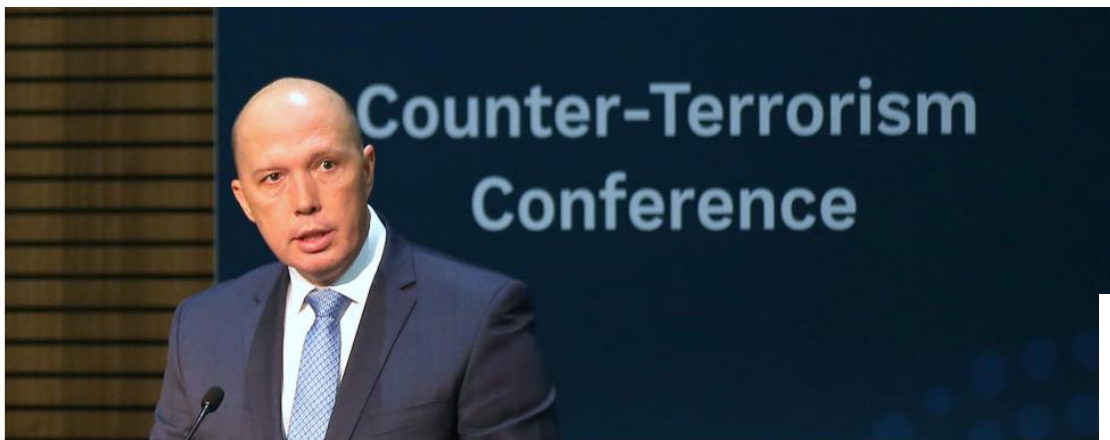
TERRORKONFERANSE: Innenriksminister Peter Dutton snakker her på en terrorkonferanse i Sidney i mars.