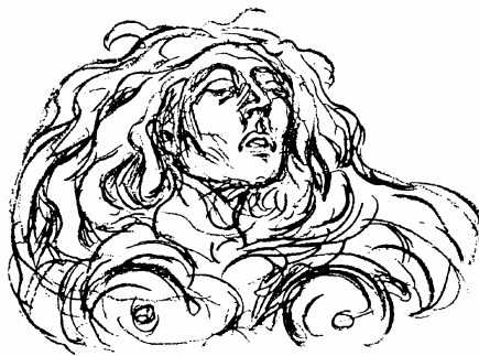
Figur2: Tegning av Edvard Munch, Sfinxen, 1909

Det gis et bredt spekter av øvelser fra de mer elektronikkorienterte til verifikasjon av fysiske lover som du kjenner eller vil bli kjent med gjennom teorikursene. Teorikursene vektlegger forståelse av sentrale fysiske lover og det er derfor ikke hovedsaken i dette kurset. Vi ber deg legge merke til dette slik at du ikke stiller med falske forhåpninger til teoretiske utfordringer. For eksempel vil vi ikke forklare hvorfor en transistor virker akkurat som den gjør men stoppe med å gjøre observasjoner av hvordan transistoren virker i praksis.