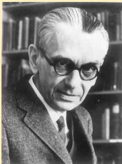
Kurt Gödel (1906-1978)