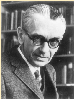
Kurt Gödel (1906-1978)