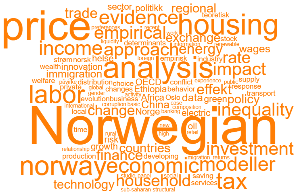
Figur 3: Ordsky basert på tittelord fra masteroppgavene under ny ordning.