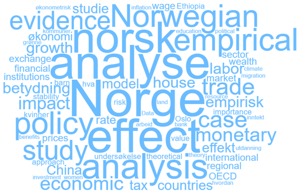
Figur 2: Ordsky basert på tittelord fra masteroppgavene under gammel ordning.